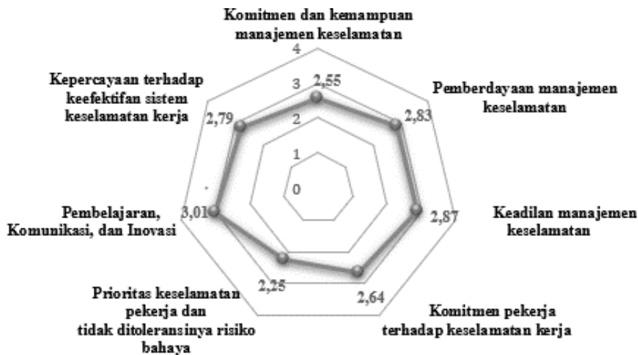
Gambar 2. Grafik Radar Tingkat Iklim Keselamatan di perusahaan jasa bongkar muat

Setelah melakukan perhitungan dengan bantuan perangkat lunak Ms. Excel dan SPSS, ditemukan bahwa semua item pernyataan dalam kuesioner valid dan dapat diandalkan. Langkah selanjutnya adalah melakukan pengukuran terhadap tingkat iklim keselamatan dengan menghitung rata-rata total dari respons para responden pada setiap dimensi iklim keselamatan. Dari sini, dapat dilihat bahwa persepsi pekerja di perusahaan yang bergerak dalam jasa bongkar muat terhadap iklim keselamatan dan perilaku keselamatan dapat dijelaskan skor masing-masing dimensi seperti pada diagram gambar 2 sebagai berikut melalui: